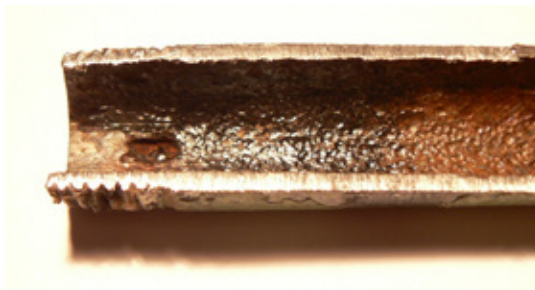
Hapen aiheuttamaa pistekorrosiota voi tulla uusiinkin putkiin.

Lisäksi suosittelemme puhdistuksen jälkeen verkoston suojausta. Suojauksella eliminoidaan jäännöshapen vaikutukset sekä ehkäistään korroosion ja kerrostumien syntyminen. Suojaus varmistaa verkoston pitkän ja häiriöttömän elinkaaren.