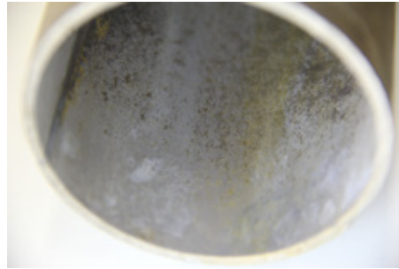
Puhdistettu uusi putki