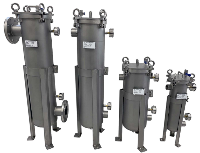
Suodatinmallit TS-M80B, TS-M50, TS-M40 ja TS-M33