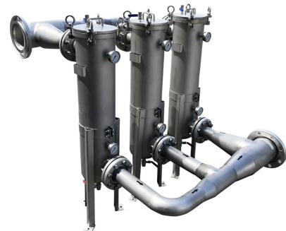
Rinnakkaisasennusmahdollisuus, jossa tulovirrat kuristettu samanlaisiksi.

Erinomaisen suodatuskykynsä ja kestäväytensä ansiosta TS-suodatinsarja soveltuu erityisesti teollisuusprosessien suodatustarpeisiin. Valikoimaan kuuluu neljä mallia, joita voidaan käyttää monipuolisesti kemianteollisuuden ja ympäristöalan suodatustarpeisiin.